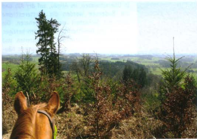
Da schlägt jedes Reiterherz höher. Das Pferdeland Oberschwaben liegt Pferd und Reiter zu Füßen.

Wanderriten ist eine stille, erholsame, umweltfreundliche Art, Freizeit und Urlaub zu genießen. Wanderriten in Oberschwaben soll deshalb auch eine „Marktlücke“ schließen und gleichzeitig den ländlichen Raum mit seinen Land- und Gastwirten fördern.