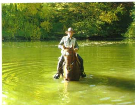
Der Weg ist das Ziel! Der Reiz des Wanderritens liegt darin, auch unbekannte Wege zu erkunden.

Der Bauernverband Allgäu-Oberschwaben bewies mit seinem Einsatz für das Wanderriten